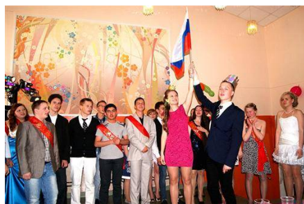
Традиционная торжественная часть