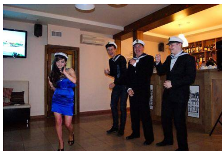
Активная развлекательная программа