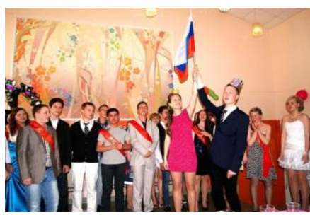
Традиционная торжественная часть