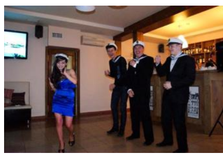
Активная развлекательная программа